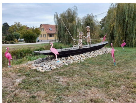
Les flamands roses ont subi de nombreuses blessures