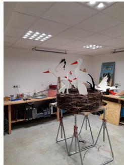
Nos cigognes ont migré dès le mois de juin

Afin d'optimiser les décorations automnales, les ouvriers communaux ont plantés les graines des curcubitacées de l'année dernière. Cela a permis à la commune un gain financier non négligeable. Hélas lors de la récolte, il s'est avéré que des personnes avaient déjà fait leur marché !!! Les décorations ont été mises en place jeudi soir vers 19h30 et vendredi matin des cageots avaient déjà disparu.