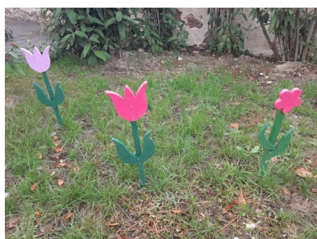
Plus de 30 fleurs ont été volées