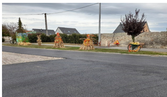
Deux jolies femmes le long de la route de Colmar.